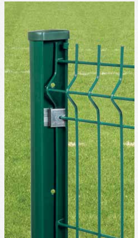
Detail de fixation